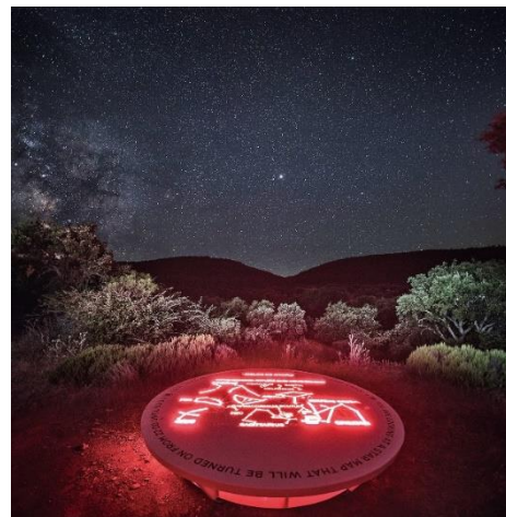
Mirador celeste de Helechosa de los Montes

Además, en once lugares de la región se han instalados Miradores Celestes, soportes de comunicación nocturnos que interpretan el paisaje estelar mostrando, de forma esquemática, las principales estrellas y constelaciones que se ven desde el punto en el que están situados. Estos miradores son unas piedras retro iluminadas, fabricados en piedra artificial y resistentes a condiciones climatológicas extremas, que incorporan la tecnología necesaria para ser iluminados selectivamente, descubriendo el mapa estelar que se esconde en su interior a la hora programada.